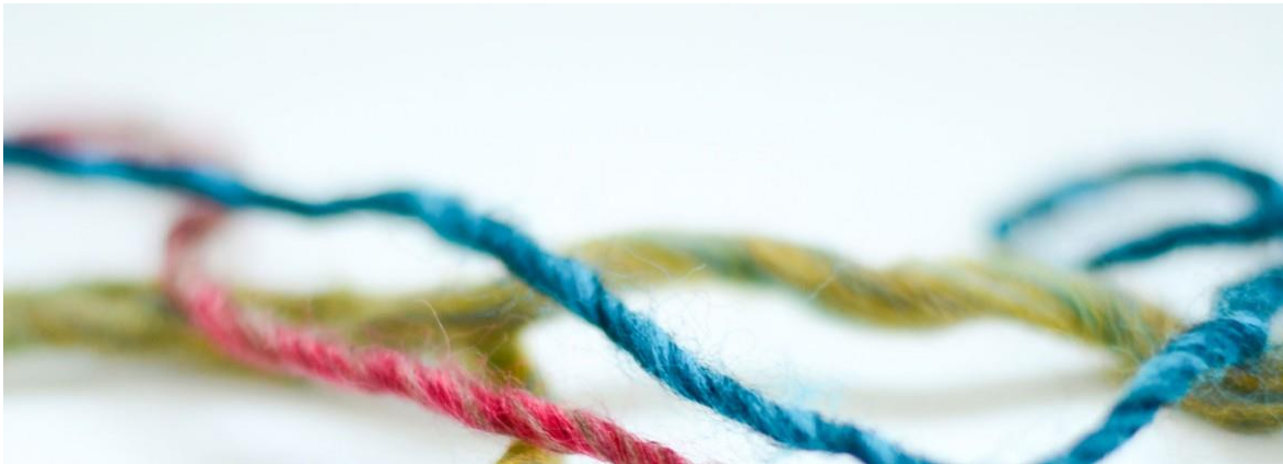
Abbildung auf Foto 1: Kartenset Selbststärkung von Frauke Nees, Beltz Verlag, Weinheim 2019 / Fotos: Paavo Blofield, Eva Burghardt, Lars Trinter